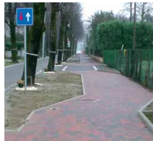
Pista ciclabile di via Stradon

La pista ciclabile lungo via Desman, strada provinciale n. 10, dal Km 0+000 al Km 2+425, il percorso è molto atteso dalla comunità in quanto mette in sicurezza la mobilità debole, come ciclisti e pedoni, in una delle provinciali più trafficate e più pericolose del territorio, già teatro negli anni scorsi di incidenti molto gravi.