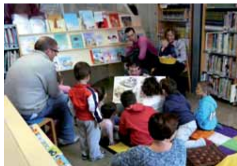
A sinistra: uno scatto rubato durante uno dei frequenti momenti di lettura ed incontri con i lettori volontari del progetto Nati per Leggere . A destra: la Biblioteca si trasforma durante l'anno per essere sempre più piacevole e accattivante.

Altra iniziativa che ha avuto un buon riscontro è stato l'allestimento e successivo arricchimento della sezione "Young Adults" dedicata agli adolescenti, una fascia tradizionalmente "critica" da raggiungere e coinvolgere. Una conferma della riuscita della nuova proposta è stato il signifi-